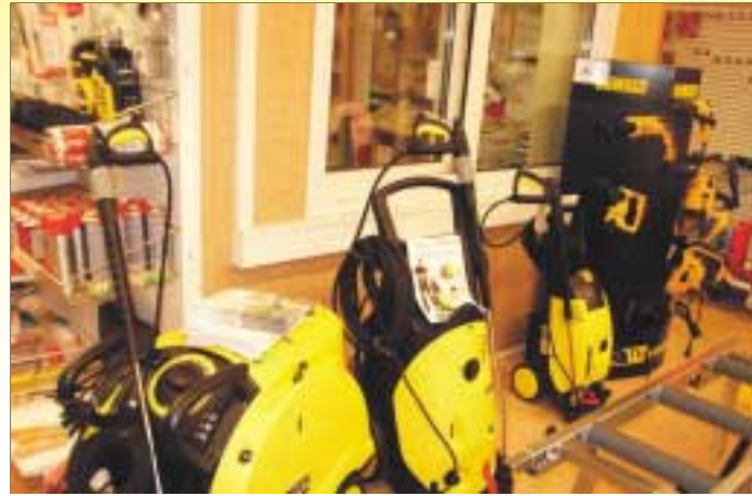
Kärcher on TekniikkaCenterin uusimpia tuote-edustuksia.