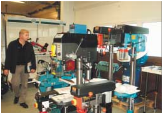
Varsinaisista myymälätiloista erillään oleva isompien koneiden ja laitteiden näyttelytila.